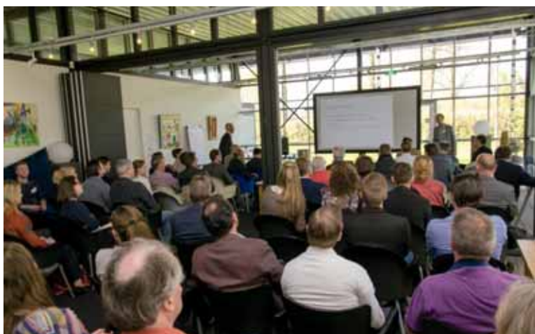
GPR gebruikers bieden groot draagvlak voor GPR Vastgoed.

definities van 'klimaatneutraal'? Gezamenlijk en eenvoudig inzicht op gebieds- en portefeuilleniveau in duurzaamheidsprestaties van vastgoed is een onmisbaar hulpmiddel bij deze gesprekken.