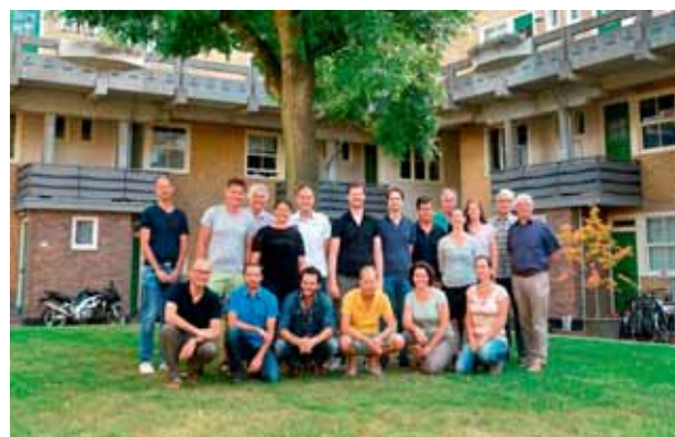
W/E adviseurs: makers van GPR software.

Zie: www.gprsoftware.nl/gpr-vastgoed/ en www.w-e.nl ●